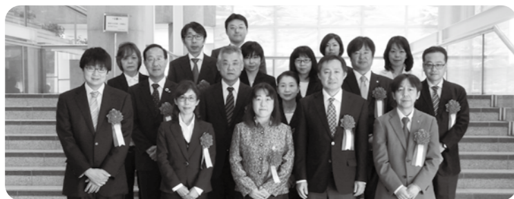
表彰された皆さん