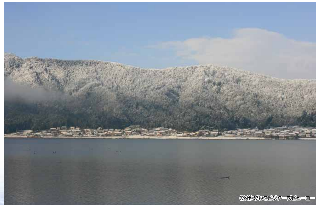
(公社)びわこデジタルズビューロー

〔長浜市:余呉湖/賤ヶ岳(約422m)を一つ隔てた琵琶湖の北にあります。古くは、琵琶湖を大江(をおうみ)、余呉湖を伊香(いか)の小江(をうみ)と称し、天女の羽衣や龍神・菊石姫の伝説が残る神秘的湖です。別名「鏡湖」とも呼ばれます。〕