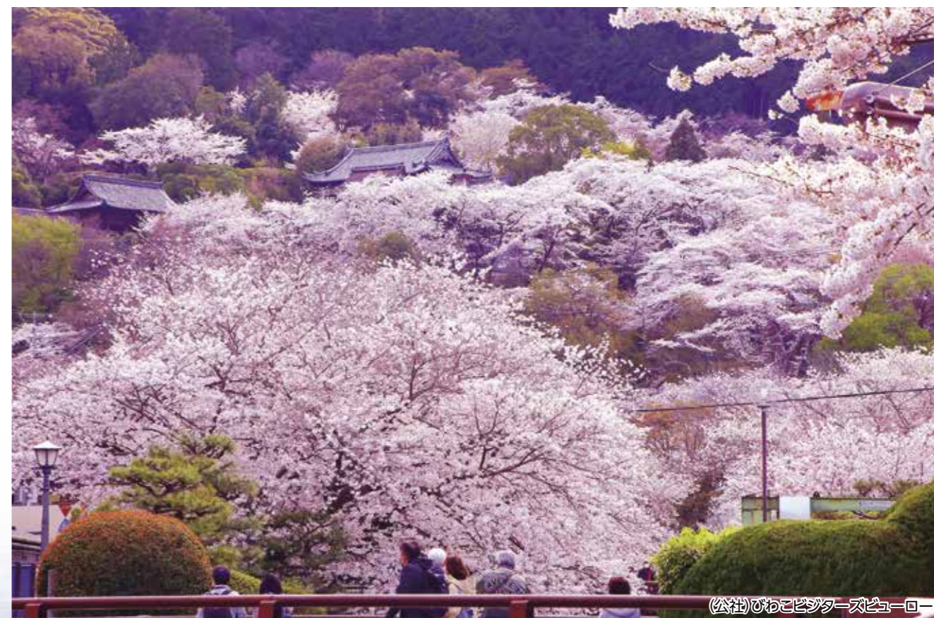
(公社)びわこビジネス・ズビューロー

〔大津市：琵琶湖疎水/琵琶湖の湖水を京都市へ流すために、明治時代に作られた人工水路。桜の名所として知られ、近代化産業遺産として認定されています。〕