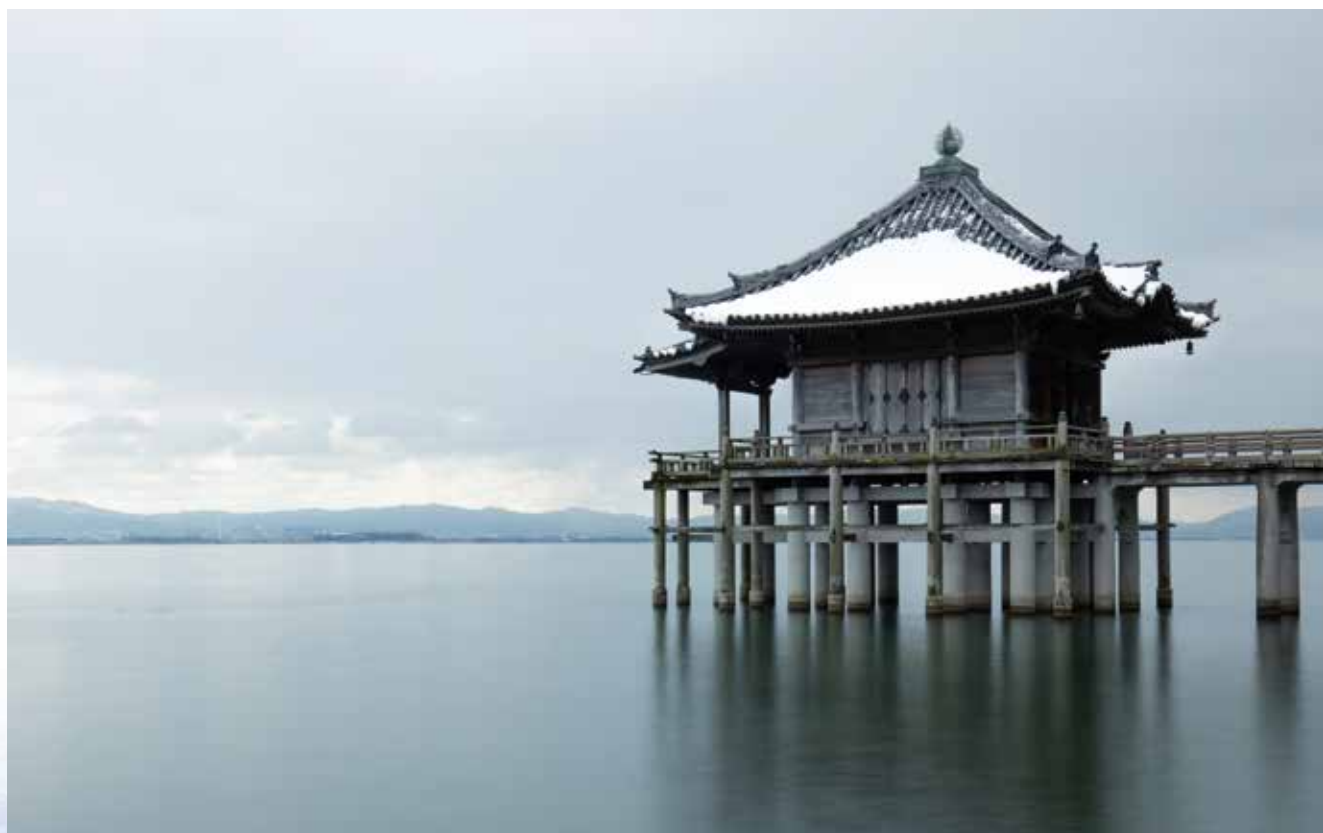
【大津市：浮御堂／近江八景「堅田の落雁」で名高い浮御堂は、寺名を海門山満月寺という。平安時代、に湖上安全と衆生済度を祈願して建立したという。境内の観音堂には、重要文化財である聖観音座像が安置されている。】