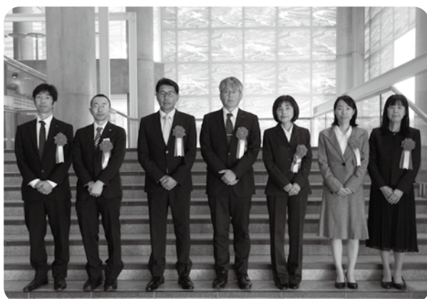
日本年金機構から表彰された皆さん

当日は、社会保険事業の推進に功績のあった方々の表彰後、委員総会、事務講習会、特別講演が行われました。