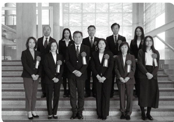
全国健康保険協会から表彰された皆さん