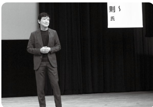
特別講演「命の食事 ～人生を2倍楽しむ法～」(南雲 吉則 様)